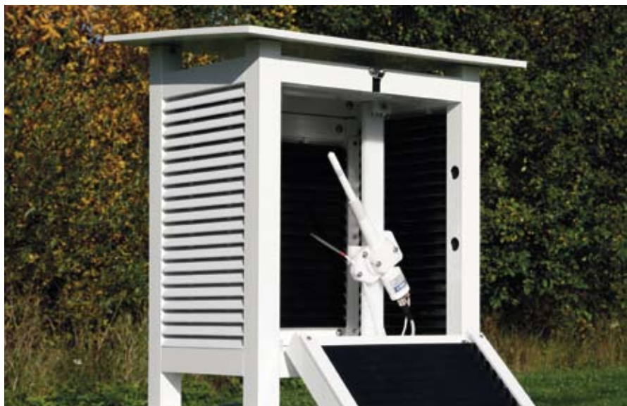
La sonde HMP155 avec le nouveau capteur HUMICAP®180R très stable et une sonde de température supplémentaire..