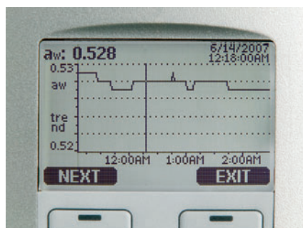
Darstellung des Messwertverlaufs in Echtzeit sowie der gespeicherten Historie

Form von Wasseraktivität ( a_w ) und Öltemperatur ( T ). Die Wasseraktivität ist ein direkter Indikator dafür, ob eine Gefahr der Wasserabscheidung als Phase besteht. Die Messung erfolgt dabei unabhängig von Typ, Alter und Temperatur des Öls.