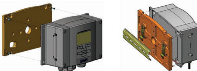
Installation mit Montageplatte